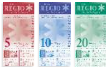
Abbildung Vorderseite REGIO im Ostallgäu